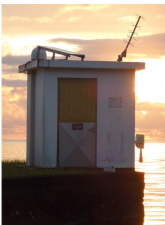
Station d'observation du niveau marin de Vairao (Tahiti-TI)

2018 à 18h en amphi A3. Entrée libre. Durée 1h + questions.